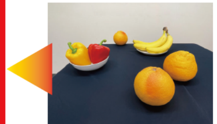
※計測画像イメージ